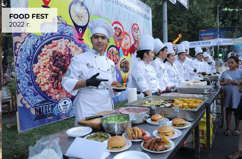
FOOD FEST 2022 г.